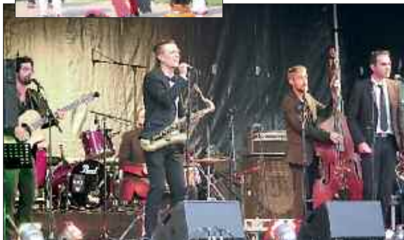
Concerts de la Fête de la Saint-Jean

Merci à tous, meilleurs vœux aux Castelvalériens et que la fête continue !