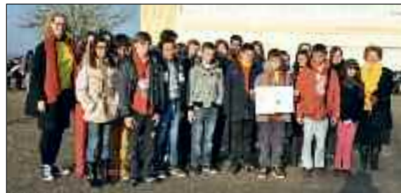
Journée Franco-Allemande 22 Janvier 2015