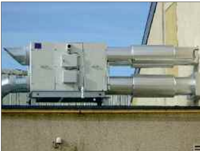
Installation du gymnase