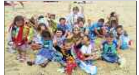
Camp des petits, la plage à St Hilaire de Riez

Nous espérons continuer à répondre présents à toutes vos sollicitations et vous souhaitons une bonne année 2016.