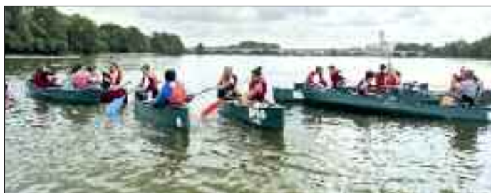
Sortie en canoë

Suite aux opérations de mutation, voici la liste des nouveaux professeurs en poste depuis septembre 2015 :