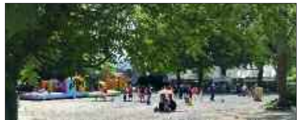
La fête du jeu - Savigné sur Lathan