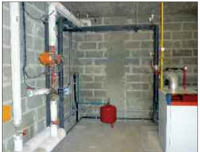
Chaufferie de la Mairie