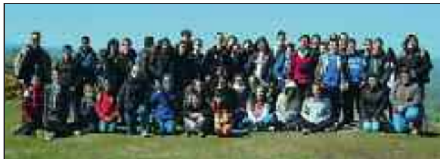
Voyage au Pays de Galles (Cardiff)

Rentrée 2014 : 252 élèves répartis en 12 classes (3 classe de SEGPA, 3 classes de 6ème, 2 classes de 5ème, 2 classe de 4ème et 2 classes de 3ème).